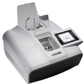
Excelon New Drill